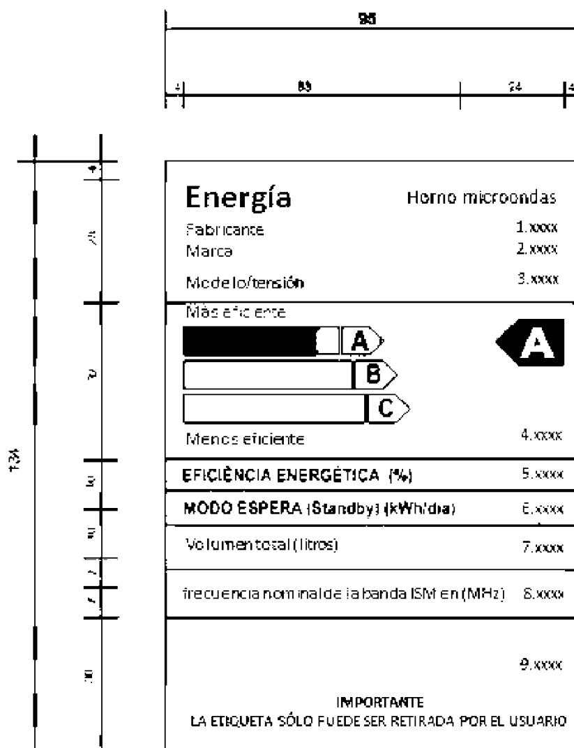
Figura 1: Ejemplo de etiqueta enfocada a la eficiencia energética de un horno microondas